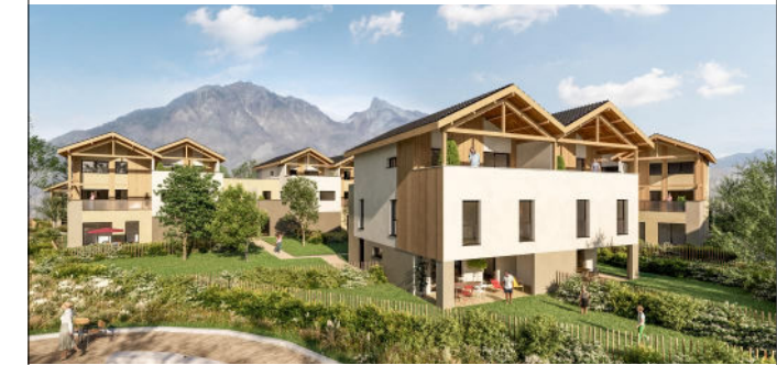
Îlot A - 73200 GILLY SUR ISERE